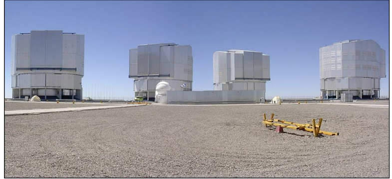
ESO, Très Grand Télescope, Observatoire du Cerro Paranal, Chili