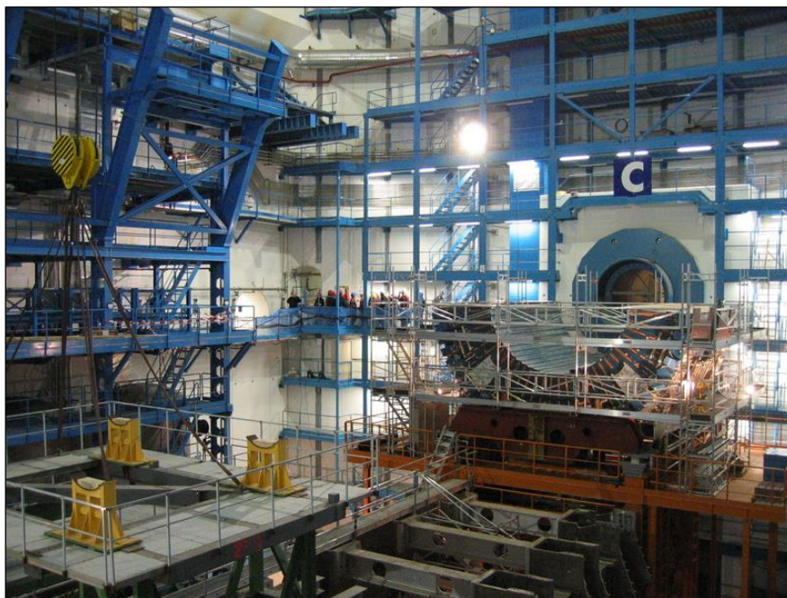
Caverne du détecteur ATLAS, CERN, Suisse