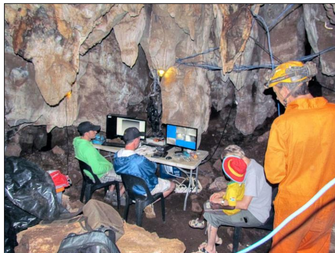
Expédition dans les grottes Rising Star, Afrique du Sud