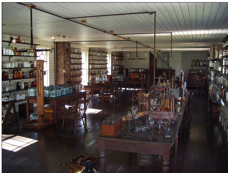
Menlo Park, laboratoire d'Edison, Etats-Unis

Note : Il est également possible de réutiliser les photographies de Marie Curie et d'Albert Einstein, issues de la Fiche 5, car on peut y voir leur environnement de travail. Il est aussi possible de diffuser aux élèves un court extrait du film A day with Thomas Edison , produit par l'entreprise General Electric que vous retrouverez ici : www.loc.gov/item/00694187/