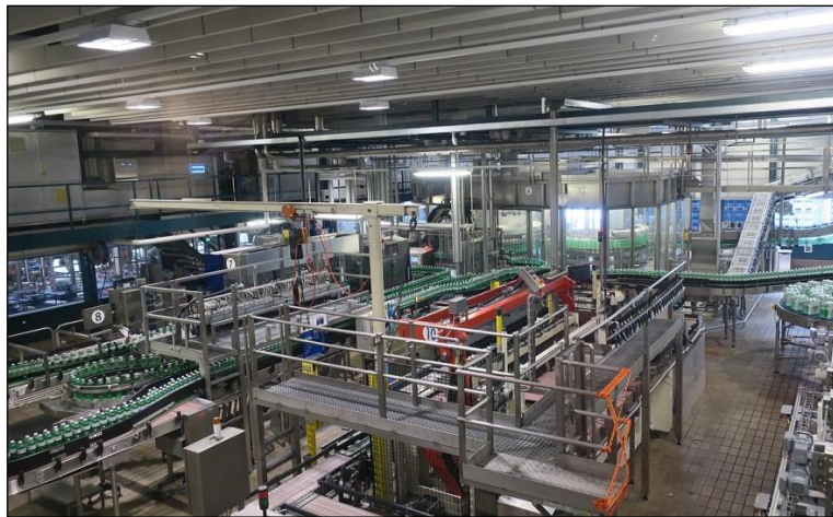
Intérieur de l'usine Valser, mise en bouteilles et transport, Suisse