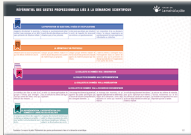
RÉFÉRENTIEL DES GESTES PROFESSIONNELS LIÉS À LA DÉMARCHE SCIENTIFIQUE