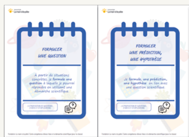
CARTES COMPÉTENCES ÉLÈVES LIÉES À LA DÉMARCHE SCIENTIFIQUE