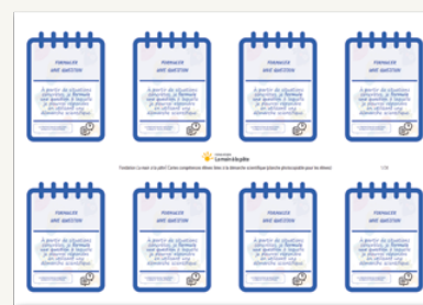
MINI-CARTES COMPÉTENCES ÉLÈVES