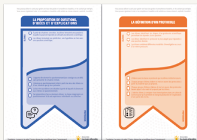
CARTES DÉMARCHE SCIENTIFIQUE