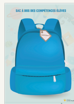
SAC À DOS DES COMPÉTENCES ÉLÈVES