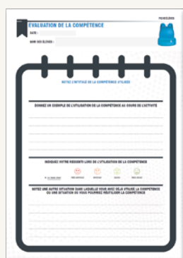
FICHE ÉLÈVE « ÉVALUATION DE LA COMPÉTENCE »