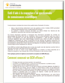
QUESTIONNAIRE DE CONNAISSANCES SCIENTIFIQUES