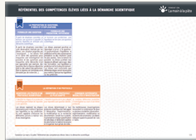
RÉFÉRENTIEL DES COMPÉTENCES ÉLÈVES LIÉES À LA DÉMARCHE SCIENTIFIQUE