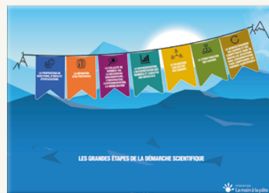
GRANDES ÉTAPES DE LA DÉMARCHE SCIENTIFIQUE