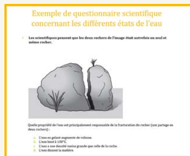
QUESTIONNAIRE DE CONNAISSANCES SCIENTIFIQUES