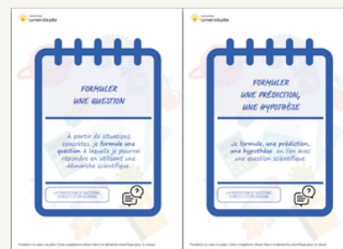
CARTES COMPÉTENCES ÉLÈVES LIÉES À LA DÉMARCHE SCIENTIFIQUE