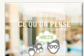
POSTERS « CE QU'ON PENSE »