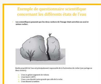
QUESTIONNAIRE DE CONNAISSANCES SCIENTIFIQUES