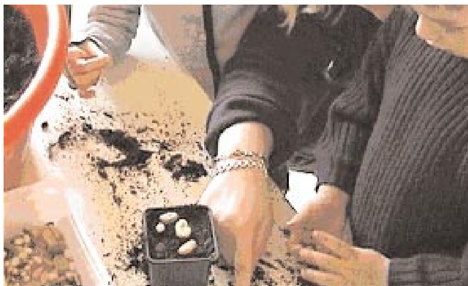
Figure 4. « J'ai mis toutes les mêmes... » Montrer qu'une même sorte de graine donne une même espèce de plante.