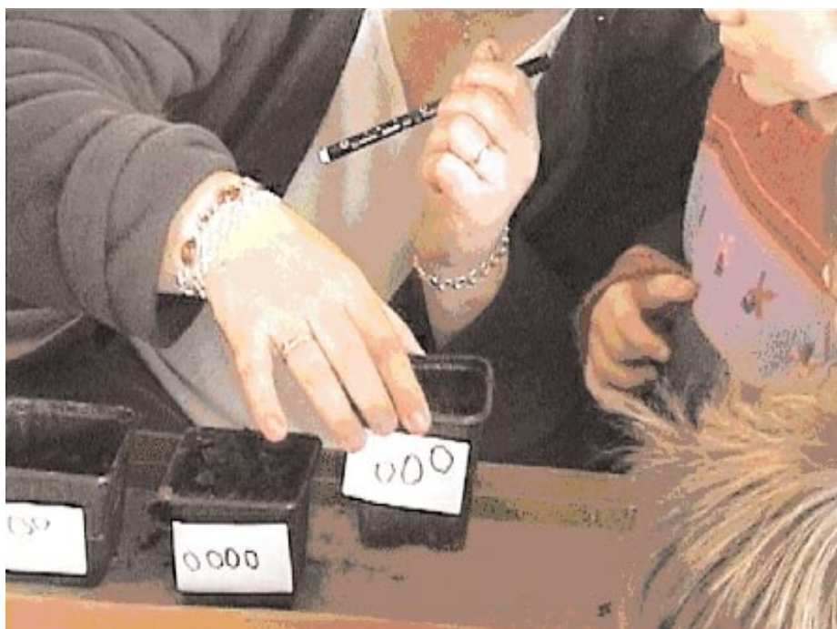
Figure 5. « Combien en as-tu dessiné ? » Correspondance une graine, une plante.

En petite et moyenne sections, faire un semis représentant la suite numérique de 0 à 10. Les pots pourront être codés avec le nombre de gommettes correspondant et le nombre écrit. Utiliser des grosses graines : fèves, pois ou haricots.