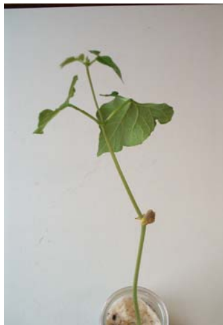
7 octobre Le cotylédon a diminué.