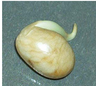
23 septembre La graine de haricot a germé.

Avant la troisième séance, tous les binômes ayant travaillé sur un même protocole, seront réunis afin de confronter leurs observations, leurs résultats et établiront un compte rendu.