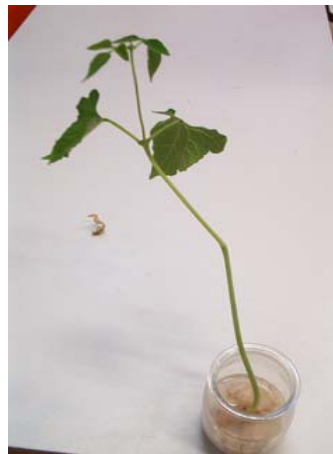
12 octobre Ce qui reste du cotylédon est tombé.