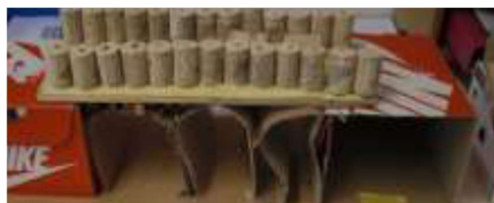
Exemples de productions d'élèves au Cycle 2